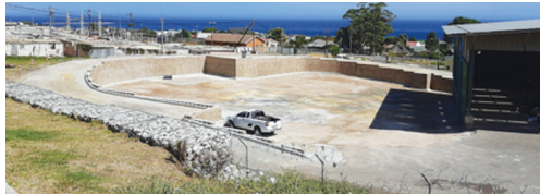
Die oorlaastasie se nuwe bekleding

Soos blyk uit die foto hieronder spog die herstellende tuinvullisstortingsterrein by Kleinmond se oorlaastasie nou met 'n retensiemuur van beton en 'n omvormde vloeroppervlak.